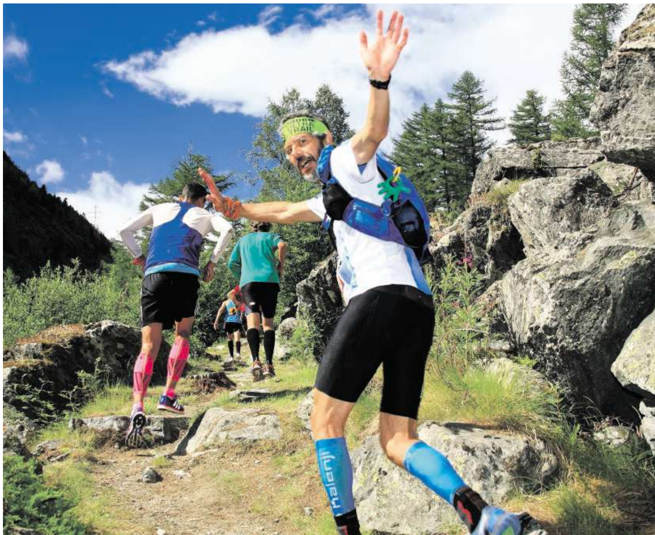
42,195 hochalpine Kilometer, Tausende beschwerliche Höhenmeter - und trotzdem Zeit für einen Gruss.